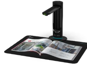
IRIScan Desk 6 Business (32 MP, A3): 449 €

Ein frisches, neues Konzept des Scannens mit der effizientesten Leistung, die Sie je gesehen haben! Dank der speziellen IRIScan Desk-Software zeichnen sich diese Scanner durch herausragende Leistung und Benutzerfreundlichkeit aus – ob beim Erstellen von Videoanleitungen, Onlinedemos oder Fernunterrichtsstunden.