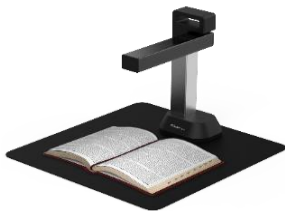
IRIScan Desk 6 (12 MP, A4): 249 €

Die neue IRIScan™ Desk 6-Serie – der professionelle vielseitige Dokumentenscanner!